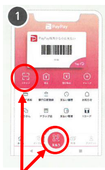
どちらかのボタンを押す