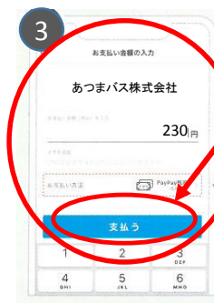
運賃を入力、乗務員に画面を見せる