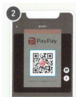
QRコードを読み取る