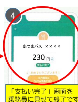
決済画面を乗務員が確認